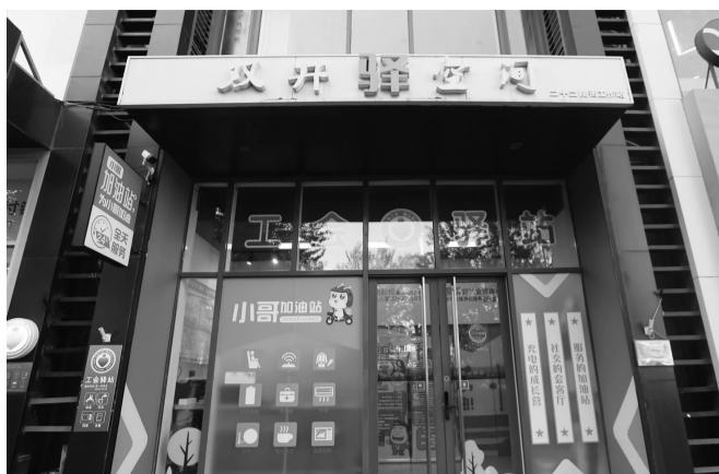
B座商业10号 地址:百子湾路32号院3号楼 双井驿空间(庆丰社区骑手驿站)

当凛冽的寒风呼啸而过,有这样一群人依然在城市的街街小巷中穿梭忙碌,他们就是快递外卖骑手。他们守护着这座城市的美味,他们与地区发展同频共振。九项基本服务全时供给,个性需求进阶服务因人而异,在双井街道庆丰社区,他们的冷暖一直被牵挂。