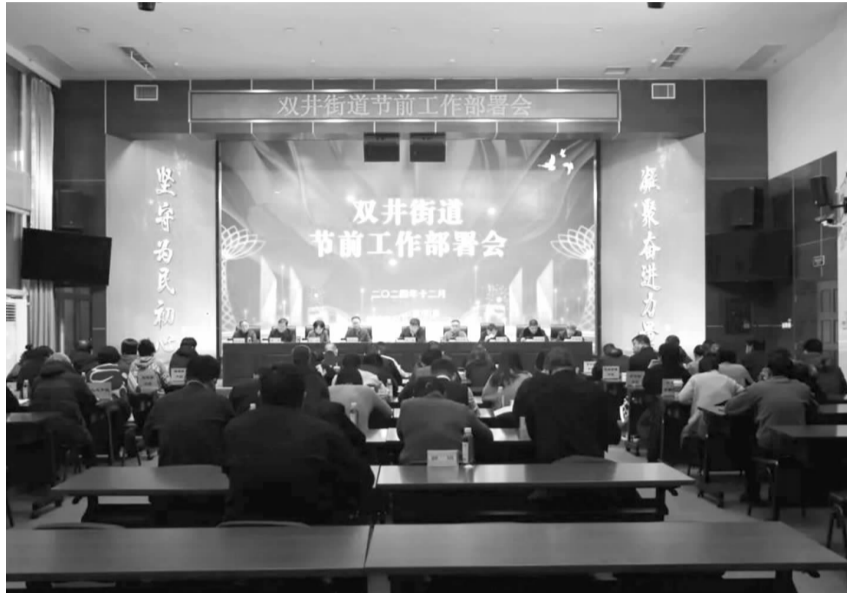
班子成员分别就近期重点工作部署安排

一是持续提升党建引领基层治理水平。要进一步深化党建品牌建设，坚持好党建引领这条工作主线，深化组织、