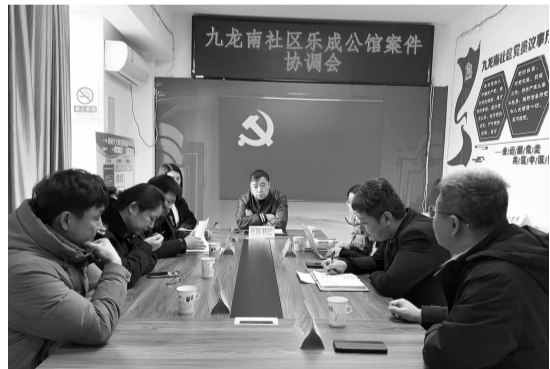
▲协调会现场各方代表讨论方案

9月26日,九龙南社区工作人员与居民进行了面对面的沟通,建议居民查看购买玻璃时签订的合同,确认